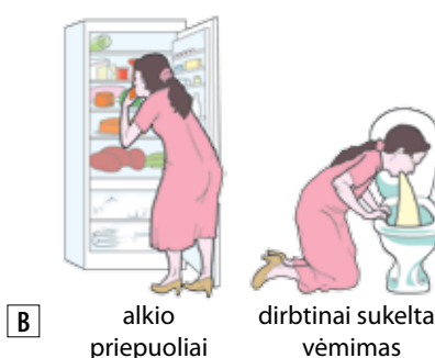
7 Anoreksijos (A) ir bulimijos (B) požymiai.