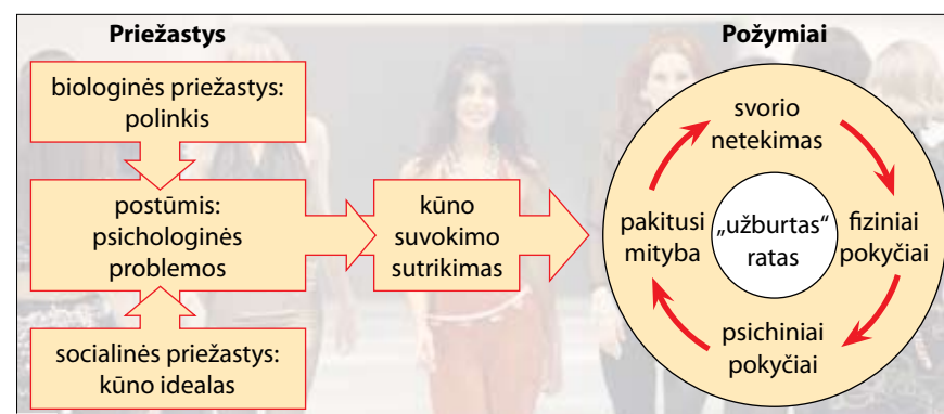
8 Mitybos sutrikimų priežastys ir požymiai.

Mitybos sutrikimų priežastys yra biologinės ir socialinės (8 pav.). Dauguma mokslininkų sutinka, kad juos dažniausiai paskatina įvairios psichologinės problemos: nesutarimai su tėvais, konfliktai mokykloje, žema savivertė, baimė būti atstumtai, vienišumas ir kt. Blogiausia, kad ligonė dažniausiai neigia turinti problemų, ir labai sunku įtikinti, jog jai reikia pagalbos.