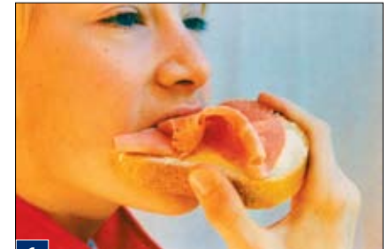
1 Virškinimas prasideda burnoje.

Žmogaus organizme virškinimas vyksta virškinimo traktė . Greta jo išsidėsčiusios virškinimo liaukos išskiria virškinimo sulčių, kurios specialiais latakais nuteka į virškinimo traktą. Virškinimo sultyse yra virškinimo fermente .